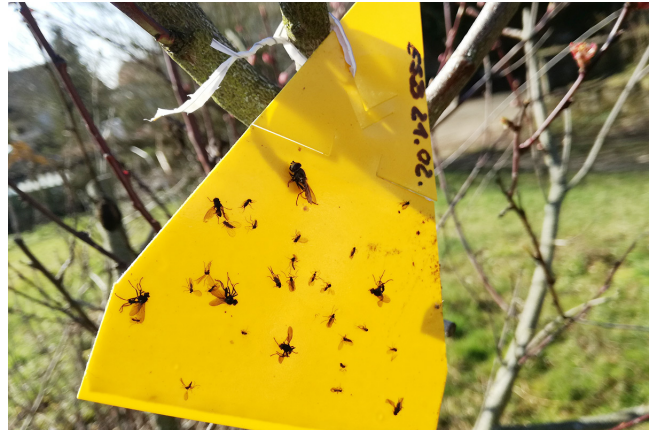
Gelbtäfelchen in Winterwirtspflanze Pfirsich