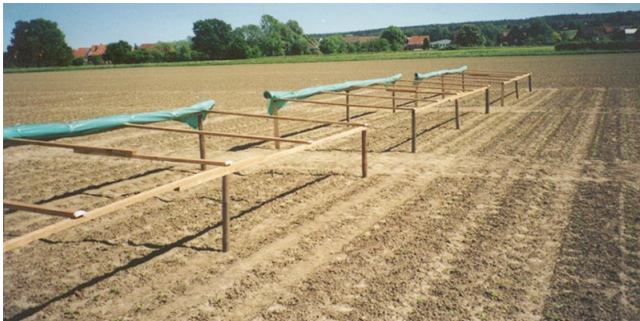
Regendach im aufgerollten Zustand bei nicht zu erwartenden Niederschlägen (Sülbeck)