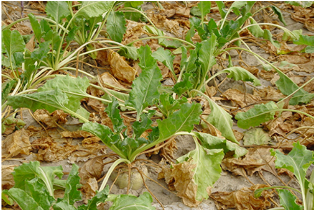
Die Auswirkungen von Trockenstress im Anbauversuch exakt erforschen.