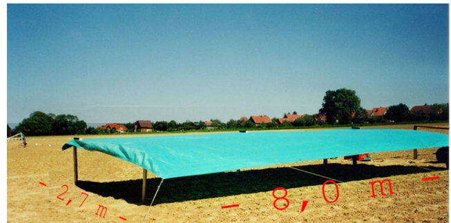
Regendach im zugerollten Zustand während bestehender oder zu erwartender Niederschläge (Sülbeck: 153 mm wurden abgefangen und Bernburg: 231 mm wurden abgefangen)